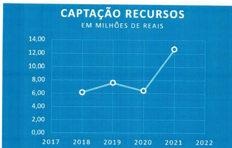
Gráfico 01. Série de recursos captados por ano

No ano de 2021 foram geridos 65 projetos com aporte financeiro de diversas fontes concedentes de recursos, que totalizaram um ingresso financeiro de R$ 12.640.100,10 (doze milhões, seiscentos e quarenta mil e cem reais e dez centavos).