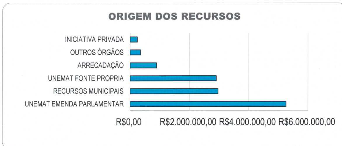
Gráfico 02. Demonstração dos recursos captados conforme a sua origem

O Gráfico 02 explicita a origem dos recursos captados pela Fundação Faespe para apoio à projeto da Unemat. As Emendas Parlamentares Impositivas foram a origem da maioria dos recursos destinados à projetos, com R$ 5,26 milhões, sendo atendidos 10 projetos de ensino e extensão universitária. Na sequência vemos os recursos municipais, destinados em sua maioria dos R$ 2,97 milhões à projetos de ensino com a oferta de turmas especiais em modalidades diferenciadas e, ainda, com Recursos Próprios da Unemat, o montante de R$ 2,9 milhões foi investido em turmas especiais integrantes das políticas internas da Unemat (Colíder, Alto Araguaia e Médio Araguaia) e em ações de Desenvolvimento Institucional, Pesquisa e Pós-Graduação.